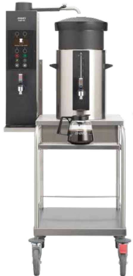
+ Modell S (Modell C ist für 2 Behälter geeignet)