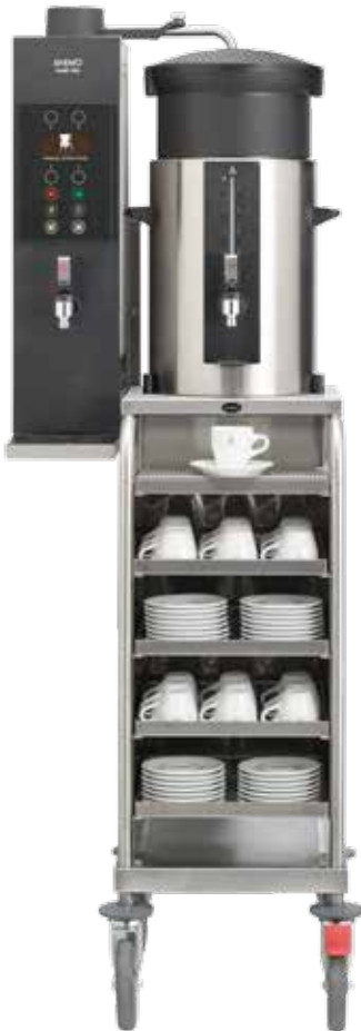
+ Modell JR (Modell ST ist für große Behälter geeignet)