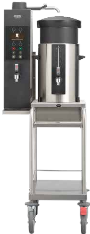
+ Modell J