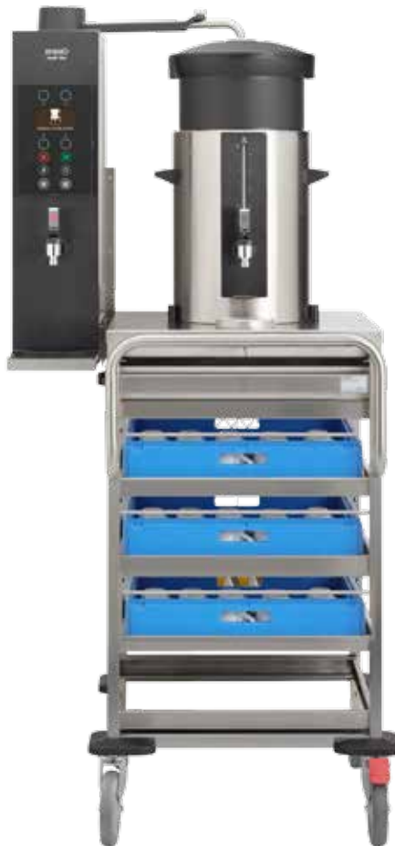
+ Modell SK 10 VL