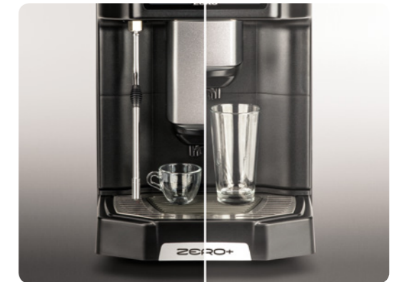
Gläser bis zu einer Höhe von 18 cm / Hauteur tasses jusqu'à 18 cm