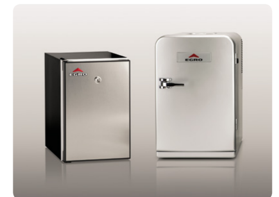
Quick-Milk Fridge, Cool Box 6.5