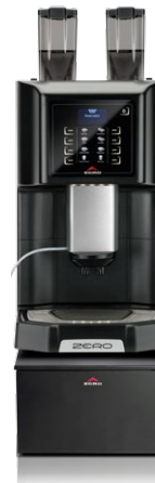
ZERO Quick-Milk NMS