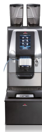
ONE Quick-Milk NMS