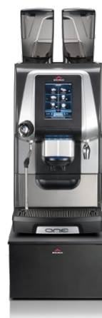
ONE Top-Milk XP NMS