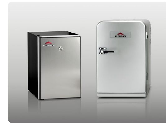
Quick-Milk Fridge, Cool Box 6.5