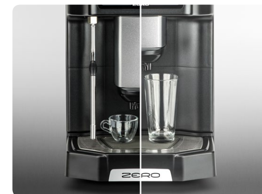
Gläser bis zu einer Höhe von 18 cm / Hauteur tasses jusqu'à 18 cm

MISCELLANEOUS Option Self (kit serrure et positionneur tasse), Kit serrures