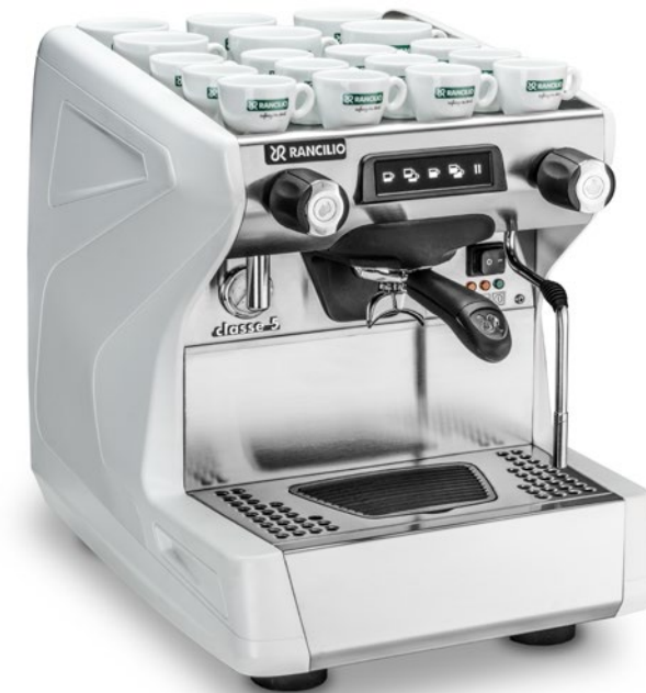
Classe 5 USB Tall 1 gr

Einfache Wartung durch nach vorne abnehmbare Front-Abdeckung und Abtropfschale.