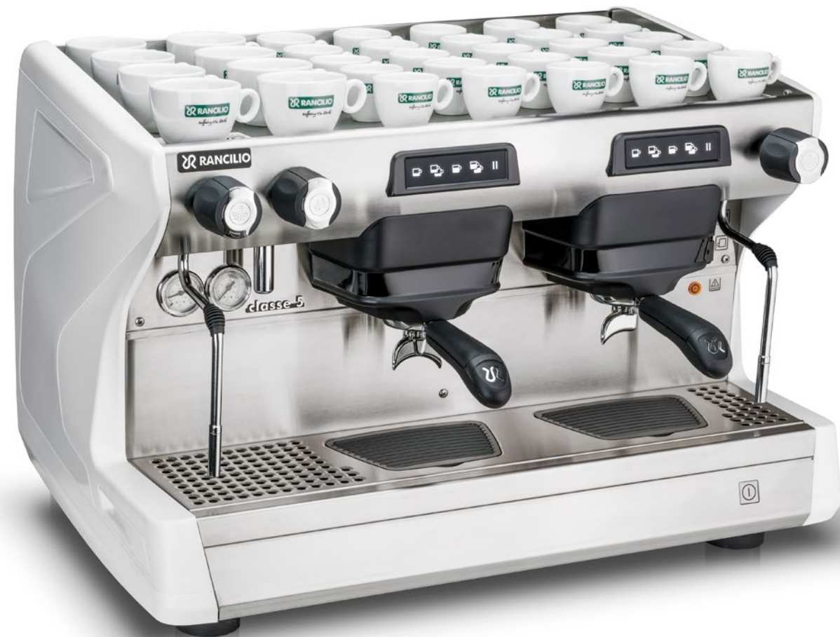
Classe 5 USB 2 gr