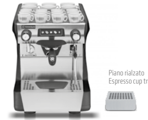
Piano rialzato Espresso cup tray