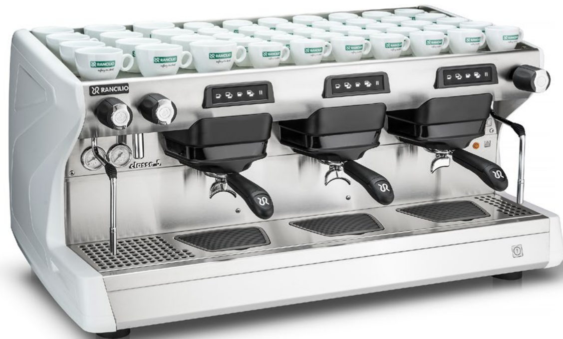
Classe 5 USB 3 gr

Moderne, durchdachte Seitenwände, große Brühgruppenfronten und ein ergonomischer Arbeitsbereich garantieren dem Barista komfortable und benutzerfreundliche Bedienung. Die Drehknöpfe der Steuerung sind griffig und angenehm in der Haptik.