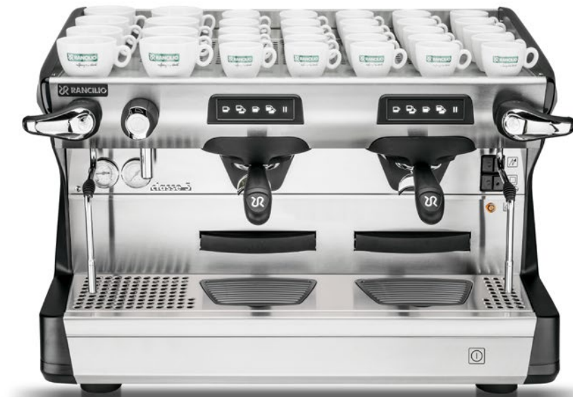
Classe 5 USB Tall 2 gr

Classe 5 est une machine en mesure d'exploiter de manière intelligente les progrès technologiques et d'être très compétitive dans son segment. Classe 5, à technologie USB ou semi-automatique, est dotée de 2 à 3 groupes diffuseurs, noir anthracite ou blanc glace. Pour les espaces de travail restreints, la version COMPACT offre toutes les performances de la classe dans seulement 61 cm de large dans la version à 2 groupes. Rancilio LAB a développé la version TALL aussi pour cette gamme de produit. Par rapport à la version standard les groupes sont rehaussés, ce qui permet d'accueillir des verres d'une hauteur allant jusqu'à 14,5 cm.