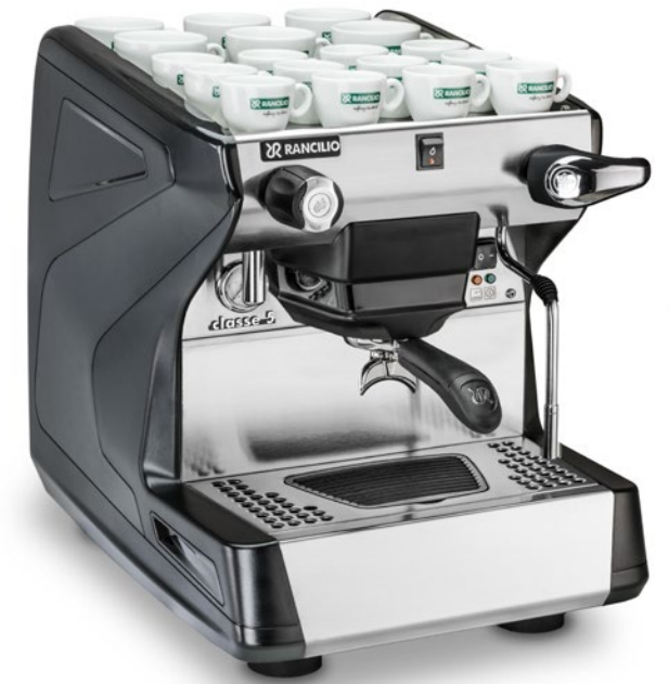
Classe 5 S 1 gr

La plupart des opérations d'assistance technique pourront être effectuées sur le devant de la machine, en retirant simplement la cuve et le panneau frontal.