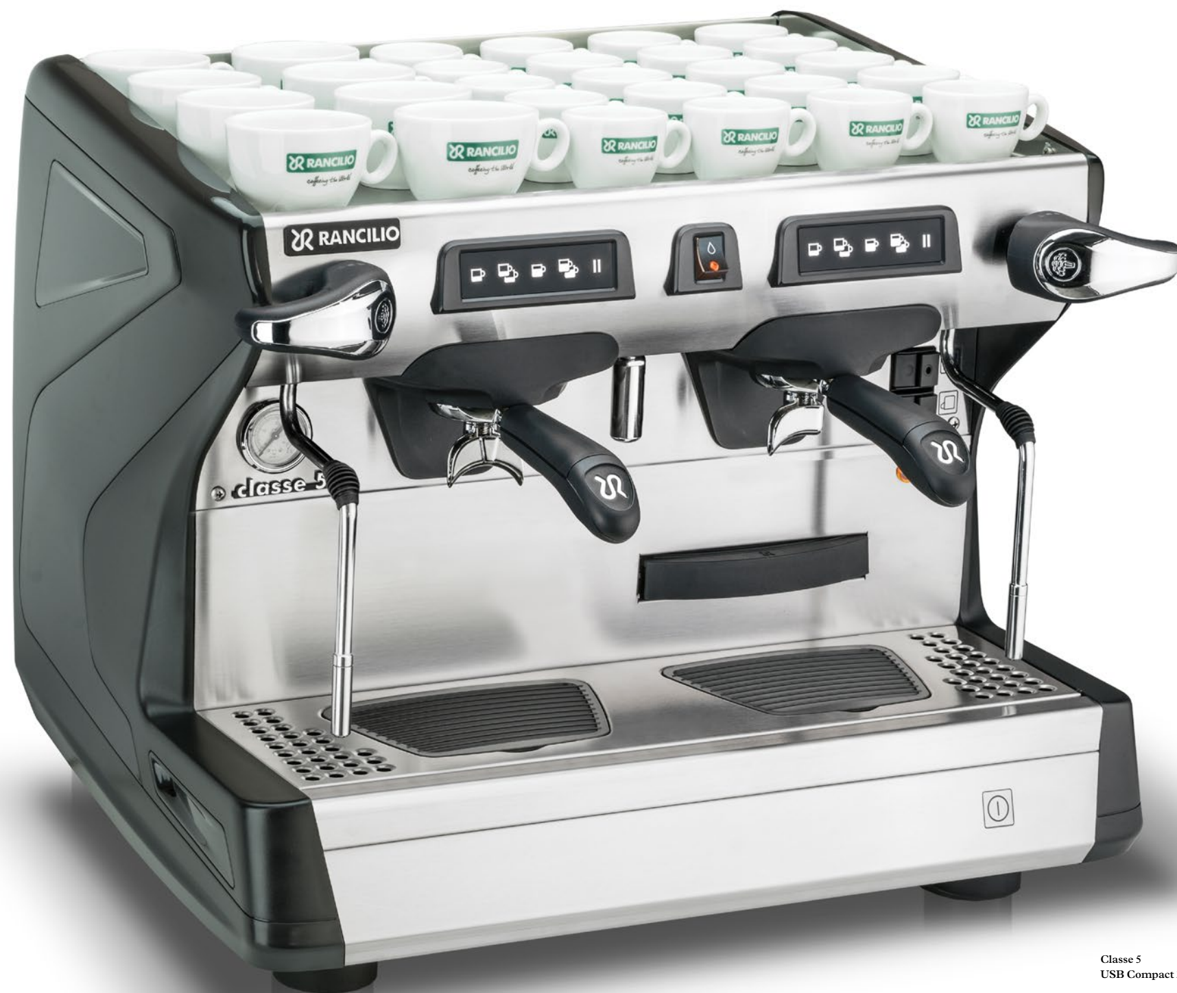
Classe 5 USB Compact 2 gr